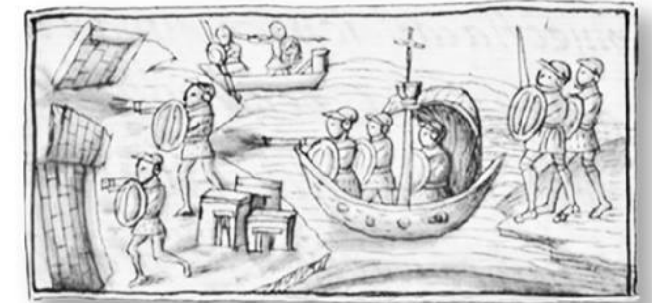
Bergantines, Libro XIII, Códice Florentino .